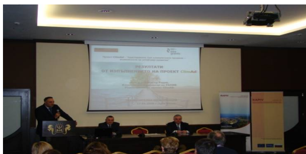
Областният управител г-н Стоян Пасев открива Конференцията

Конференцията е открита от г-н Стоян Пасев, областен управител на Област Варна. Събитието получи широк отзвук в медиите, в резултат от проведената пресконференция и премина при засилен интерес от страна на широката общественост и от представителите на местната и регионалната власт.